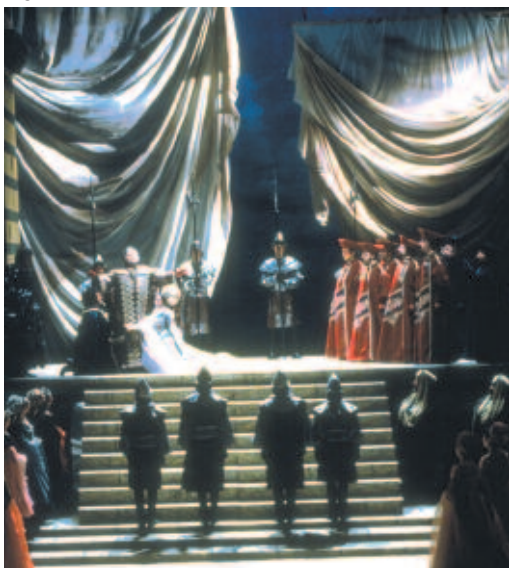
Bocca Negra - Koninklijke Opera