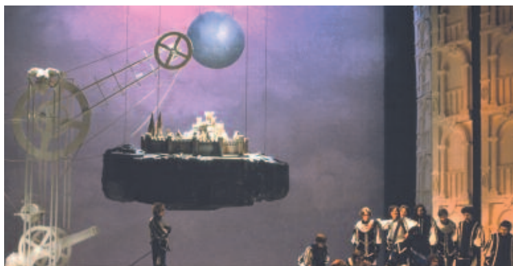
Cyrano de Bergerac - Nationaal Theater van België