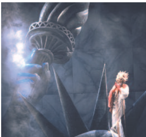
Caligula - Nationaal Theater van België

Een levensecht decor met het authentieke "lichtgordijn"