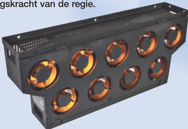
Het echte "lichtgordijn"

Een krachtig instrument voor het bevorderen van de creativiteit en het versterken van de uitdrukkingskracht van de regie.