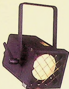
A 56 C 9 - 66°

Lentille prisme convexe pour un faisceau semi-net