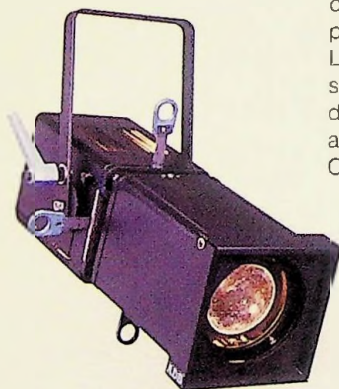
A 59 Z 16 - 35°

Lentille Fresnel pour un faisceau à bords doux