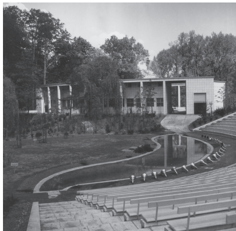
Afbeelding 4: Werken aan het Openluchttheater Rivierenhof (1952-53).