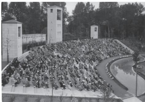
Afbeelding 6: Gudrun door Albrecht Rodenbach. Inhoudigingsvoorstelling van het Openluchttheater Rivierenhof (6 juni 1953).