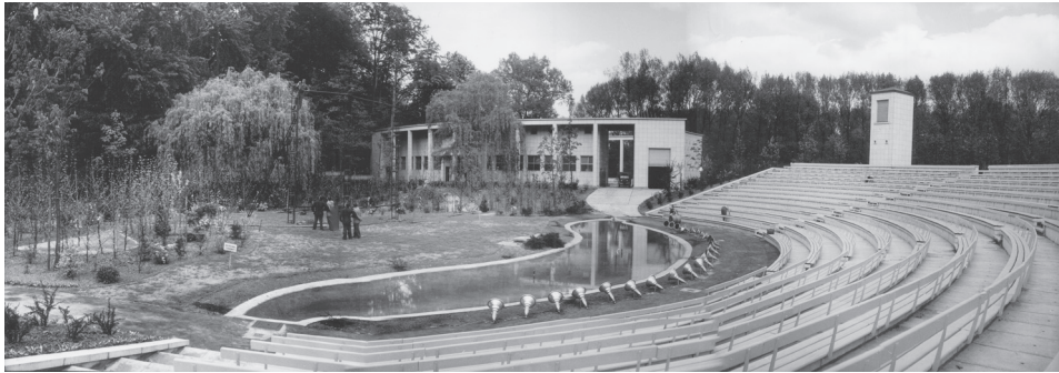
Afbeelding 1: Het afgewerkte Openluchttheater Rivierenhof (1953). Panorama samengesteld op basis van foto's uit het Provinciearchief Antwerpen.

kunstdiscours uit op de totstandkoming van deze voor de stad Antwerpen nieuwe en zelfs gigantisch te noemen opvoeringslocatie? Voor het beantwoorden van deze vraag zullen we het woordgebruik van Declerck in 1953 traceren tot in de periode tussen het fin de siècle en WO II. Twee welbepaalde culturele modes dienen als leidraad, te weten het openluchttheater en het massaspel. Tegen de achtergrond van deze discursieve ontwikkeling schetsen we de verschillende stappen in de totstandkoming en bouw van het Openluchttheater tussen 1922 en 1953.