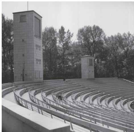
Afbeelding 5: Werken aan het Openluchttheater Rivierenhof (1952-53).

amateurverenigingen zich vol enthousiasme op de ‘nieuwe’ uitdrukkingvorm en, zoals het citaat van Cornet laat zien, werd het openluchtproject door lokale politici ook verbreed tot een plek voor volkscultuur in de meest brede zin van het woord (inclusief optredens van sport- en muziekverenigingen). Het schijnbaar eenvoudige begrip ‘openluchttheater’ werd zo gedurende de eerste helft van de twintigste eeuw opgerekt tot een gedifferentieerd ideologisch object. Dat wordt op een uitgelezen manier geïllustreerd door de discussies binnen de Antwerpse provincieraad over de keuze van de openingsvoorstelling. In november 1951 werd er binnen de Commissie van het Rivierenhof voor het eerst gepraat over de inhuldiging van het theater. Er werd voorgesteld om de ideologische lijn van ‘een theater voor het volk’ resoluut door te trekken en te kiezen voor liefhebbersgroepen in plaats van de officiële schouwburgers. Dat zou een expliciete keuze betekend hebben voor het zowel landelijk als stedelijk goed verspreide amateurtoneel (overkoepeld door toneelcentrales van respectievelijk liberale, socialistische en katholieke strekking), maar vooral had het een keuze tegen het professionele toneel betekend, dat sterk met de grootstad werd geassocieerd.