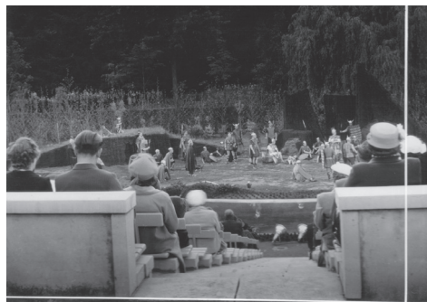
Afbeelding 7: Gudrun door Albrecht Rodenbach. Inhoudigingsvoorstelling van het Openluchttheater Rivierenhof (6 juni 1953).

uit het Belgische volkslied gespeeld, wat al gelijk het Vlaamse ‘strijdstuk’ in een welbepaald kader plaatste. Gudrun werd, zoals ook de boven aangehaalde programmabrochure duidelijk maakte, opgevoerd als een museaal, tot ‘klassiek’ verheven – en dus van elke reële politieke lading ontdaan – stuk flamingantisch erfgoed binnen het bredere en eigenlijke politieke kader van de Belgische staat in heropbouw.